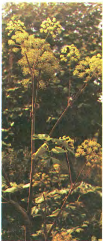
69. Дягель лікарський.